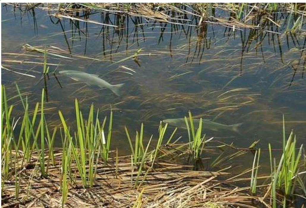
Az MTA hírei alapján

A balatoni befolyókon végzett tavaszi vizsgálataink nem mutattak lényeges eltéréseket a tavalyi eredményeinktől. Ezek szerint a befolyók állományait a tél során nem érte károsodás. Tavasszal a befolyók torkolati szakaszain gyakran megfigyelhetők a tóban gyakori fajok ívóhelyet kereső egyedei. Felméréseink során sok esetben kerültek a hálóra dévérkeszeg, karika keszeg és a folyami géb egyedek. A mellékelt fotón egy természetes balin-pár kergetőzik a Tetves-patak Balatonlelle melletti torkolati szakaszán.